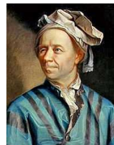
Léonhard Euler 1707-1783 Suisse